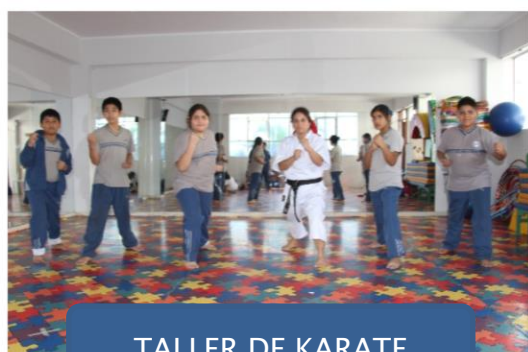
TALLER DE KARATE

Consideramos que, para desarrollar las diversas habilidades de nuestros estudiantes, promovemos diversos talleres artísticos (teatro, música, banda escolar, mimo) deportivos (fútbol, vóley), manualidades, ajedrez, entre otros.