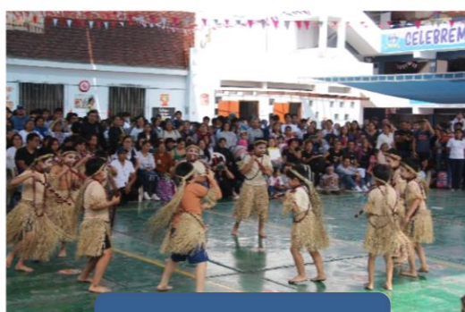
TALLER DE DANZA