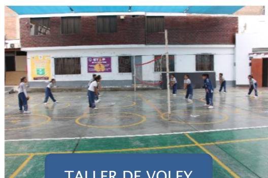
TALLER DE VOLEY