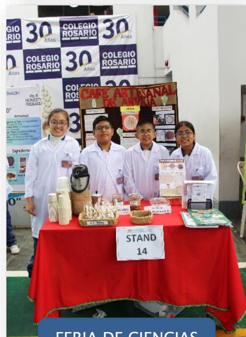
FERIA DE CIENCIAS